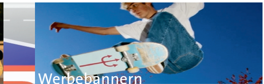
Sponsoring und Festeinblendung von Werbebannern