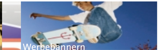
Sponsoring und Festeinblendung von Werbebannern